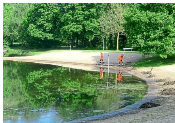
Saerbecker Bauhofmitarbeiter harken den Strand.

Um 10 Uhr trifft das erste Rettungsteam am Sonntag ein. Spätestens. Am frühen Nachmittag öffnet das Naturbad dann seine Pforten.